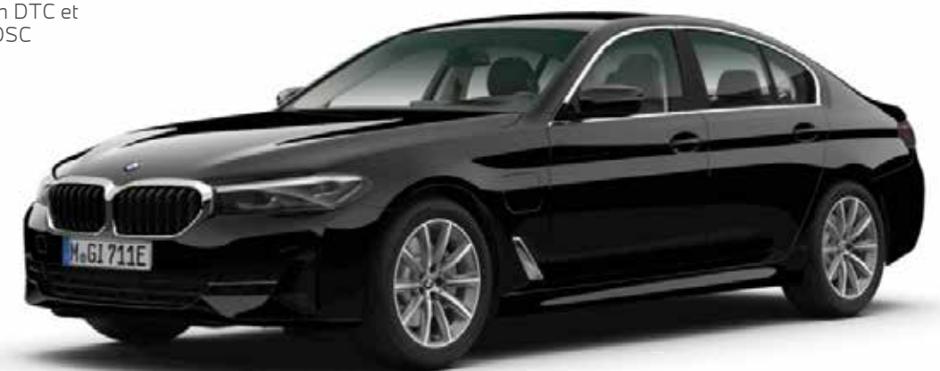
BMW 530e Berline dans la teinte de carrosserie "Schwarz" avec jantes 18" style 684