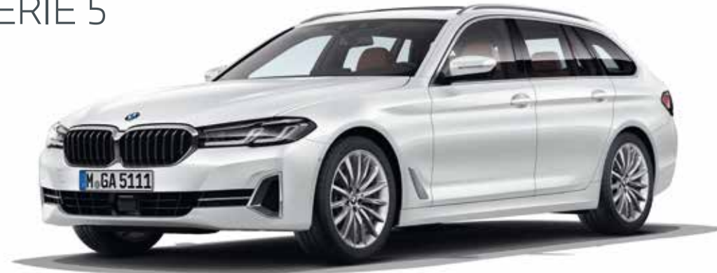
BMW 530d Touring dans la teinte de carrosserie "Mineralweiss" avec jantes 19" style 633