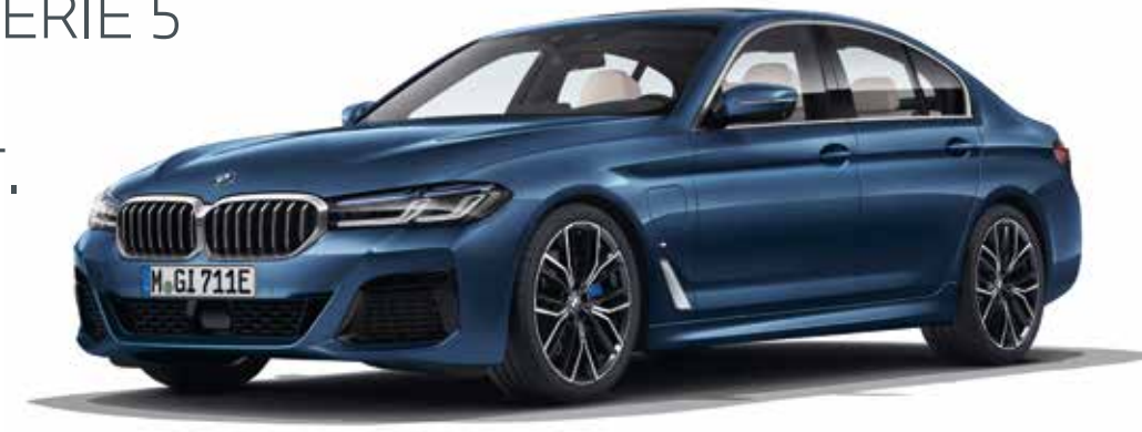
BMW 530e Berlin dans la teinte de carrosserie "Phytonicblau" avec jantes 20" style 846M